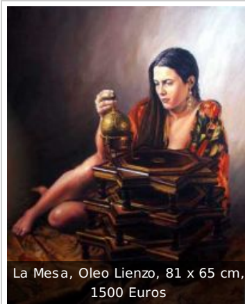
La Mesa, Oleo Lienzo, 81 x 65 cm, 1500 Euros